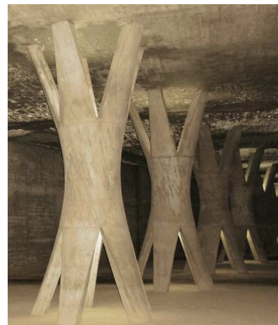
Sala hipòstila. Presa de Susqueda